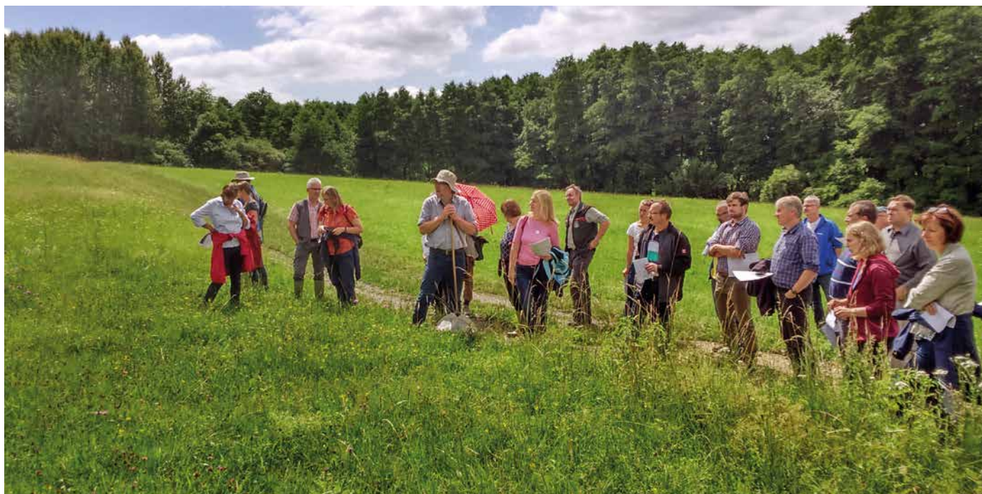
Abb. 3: Gebietsbegehung im Rahmen der FFH-Gebietskonferenz zum FFH-Gebiet 5120-302 „Maculinea-Schutzgebiet bei Neustadt“

Ein herausragendes Beispiel positiver Art ist das FFH-Gebiet 5423-303 „Kalkberge bei Großenlüder“. In diesem Schutzgebiet wurden ausnahmslos alle Ziele erreicht. Alle FFH-LRTen verbesserten sich im Erhaltungszustand und zeigten durchweg Flächenzuwächse. Dem gegenüber stehen beispielsweise die FFH-Gebiete 5120-302 „Maculinea-Schutzgebiet bei Neustadt“ (Abb. 3) oder auch 6317-302 „Magerrasen von Gronau“. In diesen Gebieten wurden qualitative und quantitative Verluste bei den Grünland-LRT, teilweise