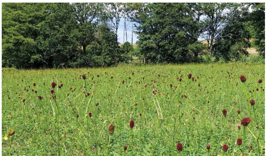
Abb. 5: Hessen hat für die Mähwiesen-Lebensraumtypen – hier mit dem für die Wiesenbläulinge wichtigen Großen Wiesenknopf als Nahrungspflanze – eine besondere Verantwortung und muss für deren Erhalt Sorge tragen.

In diesem Zusammenhang muss auch die Vertragsverletzung Nr. 2019/2145