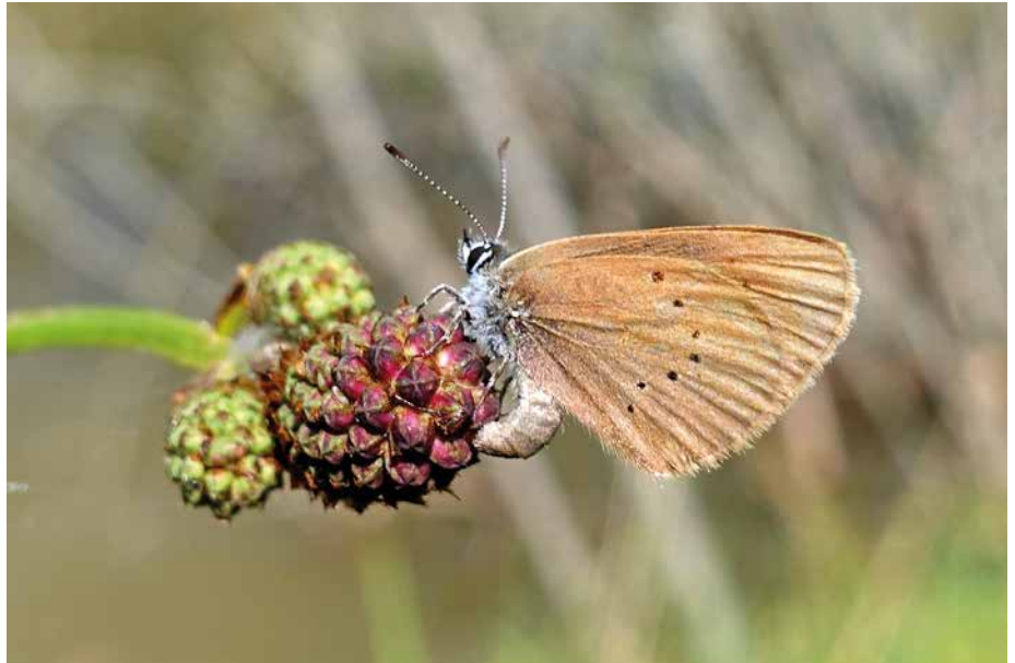
Abb. 4: Dunkler Wiesenknopf-Ameisenbläuling bei der Eiablage am Rande eines osthessischen FFH-Gebietes

Als Ergebnis der ersten Verfahren lässt sich festhalten: FFH-GK sind geeignet, kleine und mittlere Probleme des Gebietsmanagements zu lösen oder zu minimieren. So konnten infolge der FFH-GK Grünland-Verträge optimiert, Triftwege und Wasserstellen für Schäfer bereitgestellt, das Management von Problem-Arten verbessert, naturferne Biotop