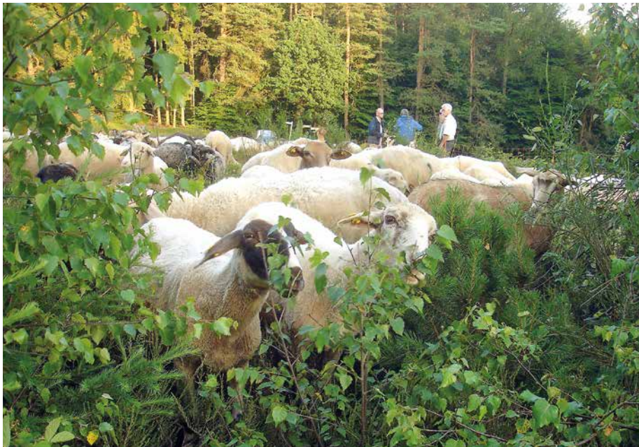
Abb. 2: Der zielgerichtete Einsatz von Schaf- und Ziegenherden zum Erhalt wertvoller Magerrasen, Wacholderheiden oder Grünlandbestände ist oft Thema in FFH-Gebietskonferenzen

FRAHM-JAUDES et al. 2019, BRAUN et al. 2019) oder durch die Regierungspräsidenten. Parallel dazu liefert das HLNUG aktuelle Art-Daten. Wo solche Daten fehlen, werden sie von den Regierungspräsidenten erhoben oder zusammengetragen.